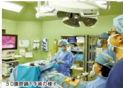
3D腹腔鏡下手術の様子

近年、高齢化がすすみ基礎疾患を有する高齢者を手術することも少なくありません。このような場合でも、総合病院の特徴を生かして内科をはじめとする他診療科のバックアップを受け安全に手術をおこなっております。また、泌尿器科や産婦人科との合同手術も行っております。287床の総合病院は決して大病院とはいえませんが、逆に他診療科の医師や他部署の医療スタッフと顔の見える関係で安全な医療が提供できていると自負しております。毎朝外科ス