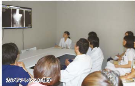
カンファレンスの様子

現在、国民の死因の第1位は悪性腫瘍です。我々外科にとって、消化器悪性疾患(癌)を治療することが、最大の使命のひとつです。消化器内科・画像診断・IVR科と常に連携を取り、病変が粘膜にとどまる早期の癌は消化器内科にて内視鏡的粘膜下層剥離術(ESD)等の内視鏡的治療を、それ以上に進行した癌は外科が担当します。癌治療ガイドラインに準拠して患者さん一人ひとりに最もふさわしい治療法を検討し、腹腔鏡