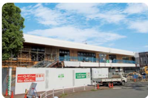
弥生台駅前再開発の様子【2017.8】

平成29年11月1日(水)に弥生台駅前に国際親善総合病院のサテライトクリニックとして「しんぜんクリニック」がオープンします。1階はリハビリテーション施設となり、医療に